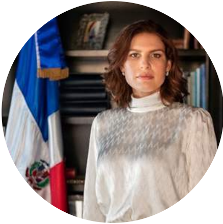
MARÍA ISABEL CASTILLO BÁEZ Embajadora de la República Dominicana en los Estados Unidos Mexicanos